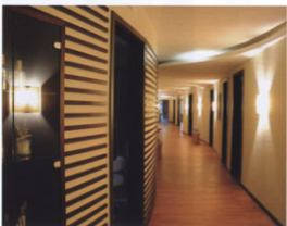
Blick in den Spa-Bereich: Entspannte Eleganz – a Home away from Home.

Aufgabe: Komplettrenovierung des Hotels mit Umbau bestehender Büroräume in Suiten