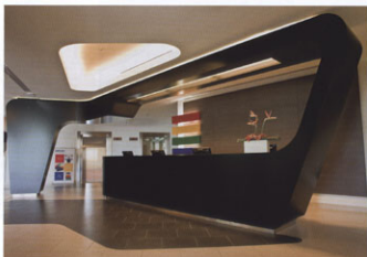
Die Rezeption als Skulptur – die starke Sprache der Architektur wird in die öffentlichen Bereiche des Hotels transportiert.

Aufgabe: Innenarchitektur öffentliche Bereiche sowie Zimmer & Suiten