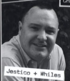
Jestico + Whiles