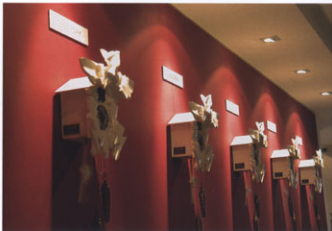
Tradition modern übersetzt – Uhrzeiten (New York, Rio, Tokio und Durbach) mit in Szene gesetzten weißen Kuckucksuhren auf knackiger Fuchsia-farbener Wand.

Aufgabe: Komplettrenovierung öffentliche Bereiche, Konferenz, SPA, sowie Zimmer und Suiten