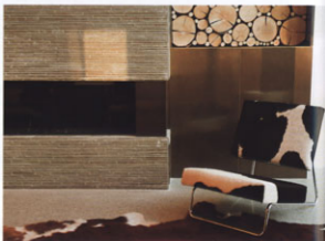
Bayern trifft auf Business – eine entspannte Mixtur als Gegenpol zum Tagungsstress: Kamin mit Kuhfellteppich.

Aufgabe: Neubau – Innenarchitektur öffentliche Bereiche, Konferenz und alle Zimmer