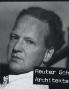
Reuter Schoger Architekten

EINE SONDERVERÖFFENTLICHUNG DER FACHZEITSCHRIFT HOTELBAU