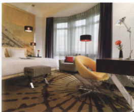
Blick in eine Junior Suite – Synonyme europäischer Luxuswerte gepaart mit dem europäischen Entdeckertum.