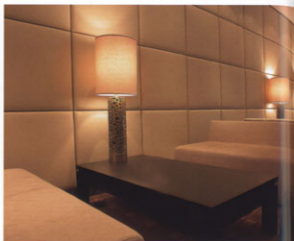
Klassisches Ambiente im modernen Design – weiße Säulen, weiße Sofas und mit hellem Leder gepolsterte Wände laden den Gast zum Verweilen ein.

Aufgabe: Renovierung aller Zimmer und öffentlichen Bereiche