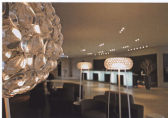
Blick in die Lobby des runden Gebäudes.

Aufgabe: Innenarchitektur öffentliche Bereiche, Spa & Konferenz- bereiche, Umsetzung der Zimmer & Suiten