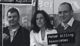
Peter Silling Associates