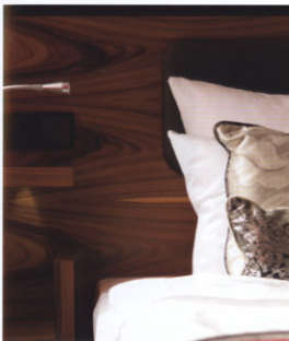
Detailansicht einer Gentlemen Suite: ein Businessauftritt in dunkel – ein Hotelzimmer wie ein Maßanzug.

Aufgabe: Komplettrenovierung der Zimmer & Suiten sowie des Restaurants Fürstehof