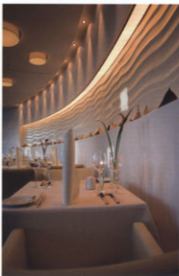
Die perfekte Welle – abstrahierte Wellenformen bestimmen das Konzept und zeigen die Nähe zum Fleet.

Aufgabe: hier Renovierung des Gourmetrestaurants